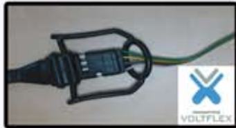
Filage en teflon VOLTFLX résistance accrue aux intempéries aux milieux salins et au feu