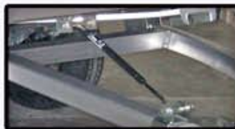
Cylindre au gaz pour la bascule