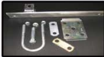
Supports d'essieux et quincaillerie en zinc iridescent