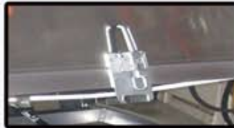
Attache sécuritaire ajustable en acier galvanisé