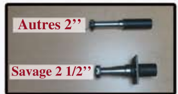
Lames de 2000 Lb avec bearing de 3500 Lb